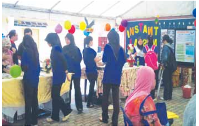
Pameran produk yang dijalankan oleh para peserta.